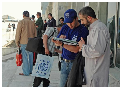
کارمندان سازمان بین المللی مهاجرت در میدان هوایی کابل از عودت کنندگان پذیرائی مینمایند

شما میتوانید برای دریافت کمک های طبی، انتقال الی محل سکونت اصلی و اعاشه و اباطه تان زمانیکه به میدان هوایی بین المللی کابل مواصلت مینمائید از مسئولین این سازمان معلومات دریافت نمائید ولی جهت ایجاد سهولت سفارش میشود که قبل از سفر ضروریات و نیازمندیهای خویش در موارد فوق الذکر را به دفتر سازمان بین المللی مهاجرت در کابل از طریق اداره امور مهاجرین سویدن و یا دفتر هلسنکی سازمان بین المللی مهاجرت در جریان قرار دهید. هنگام مواصلت به کابل اوراق اطلاعاتی بزبان مادری تان که حاوی اطلاعات ضروری و آدرس های دفاتر